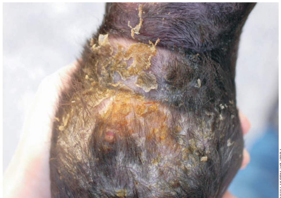
Exsudative Form der Fesseldermatitis. Die Haut ist gerötet und es gibt feuchte, krustige Beläge.

Erstveröffentlichung in "veterinärspiegel team konkret".