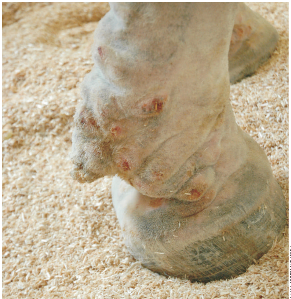
Warzenmauke bei einem Kaltblüter, nach Ausscheren des Fesselbehangs. An der Fessel ist eine starke Falten- und Knotenbildung der Haut zu beobachten.

Die ersten Hautveränderungen erscheinen an den Beinen und/oder im Gesicht und breiten sich dann weiter auf den Körper aus. Zuerst sieht man Pusteln und Papeln, aus denen sich später Erosionen, Krusten, Haarausfall und Schuppen entwickeln. Juckreiz und Schmerzen sind möglich. Viele Pferde sind allgemein krank und zeigen Apathie, Inappetenz und Fieber.