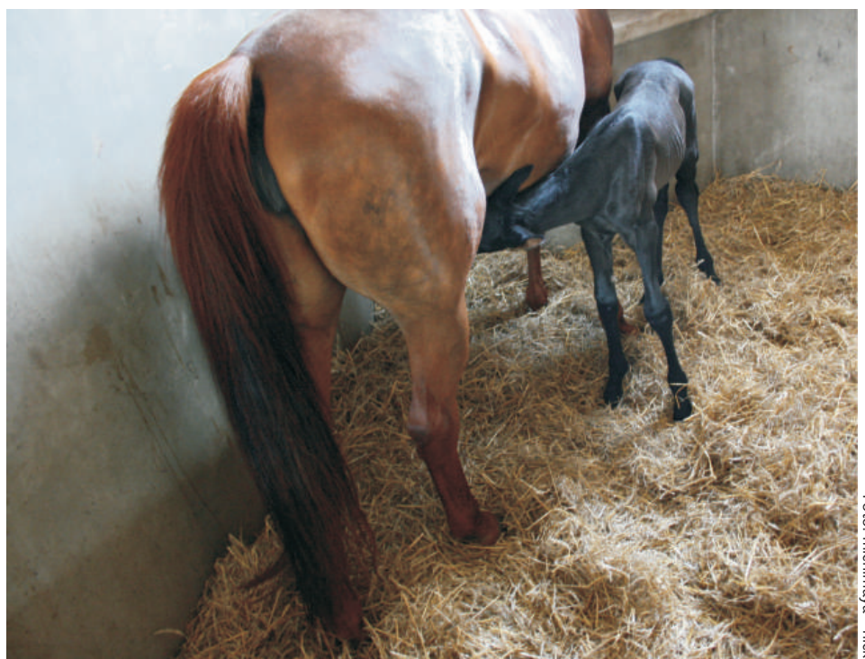
Fohlen, die mit der Biestmilch nicht genügend Antikörper aufnehmen, sind anfälliger für Erkrankungen jeglicher Art.

Vor allem bei blutigem Durchfall und deutlichen klinischen Erscheinungen muss der Tierarzt sofort mit antibakteriell wirksamen Medikamenten eingreifen.